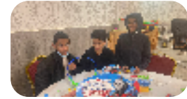
مسابقة مهندس القطار