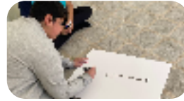
مسابقة أجمل نحت