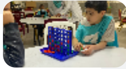
ألعاب زكاء و تحدي