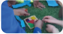
مسابقة الكنز المفقور

مسابقات و ألعاب حركية تهدف إلى رمح المتعة مع تنمية العقل و المهارات المصاحبة